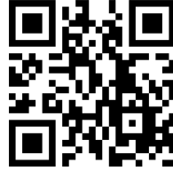
Şekil 1: Sınav Yeri Adresi Kare Kodu

Süleyman Demirel Üniversitesi Spor Bilimleri Fakültesi Özel Yetenek Sınavları Süleyman Demirel Üniversitesi Spor Bilimleri Fakültesi Atatürk Spor Salonunda Doğu Yerleşkesi, Çünür/Isparta' da yapılacaktır.