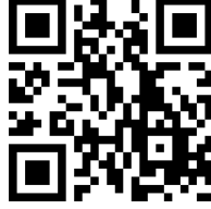
Şekil 3. Sınav Yeri Adresi Kare Kodu

Süleyman Demirel Üniversitesi Spor Bilimleri Fakültesi Özel Yetenek Sınavları Süleyman Demirel Üniversitesi Spor Bilimleri Fakültesi, Atatürk Spor Salonu Doğu Yerleşkesi, Çünür/ISPARTA' da yapılacaktır.